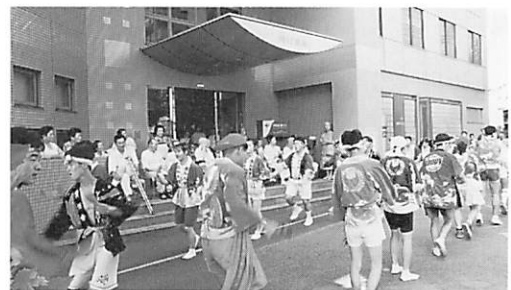
高知大学おどり子隊

8月11日、よさこい祭・高知大学のおどり子隊が来てくれました。患者さんも大ぜいが喜んで見せてもらいました。