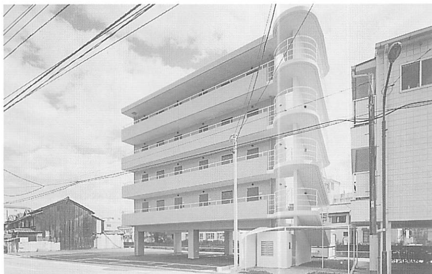
看護婦寮「ソロリティー岡村」新築落成

私たちは、患者さん本位を第一に考え 高度な専門医療技術をもって 地域社会に貢献することを目指します。