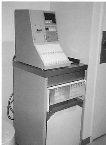
(全自動蓄尿処理器)

がその量、比重を記憶しておりますので、1日たった所で機械のスイッチを入れますとすべてのデータが打ち出されるシステムとなっております。看護婦さんにとりましても省力化の機械となっております。ちなみに価格は1台238万円です。