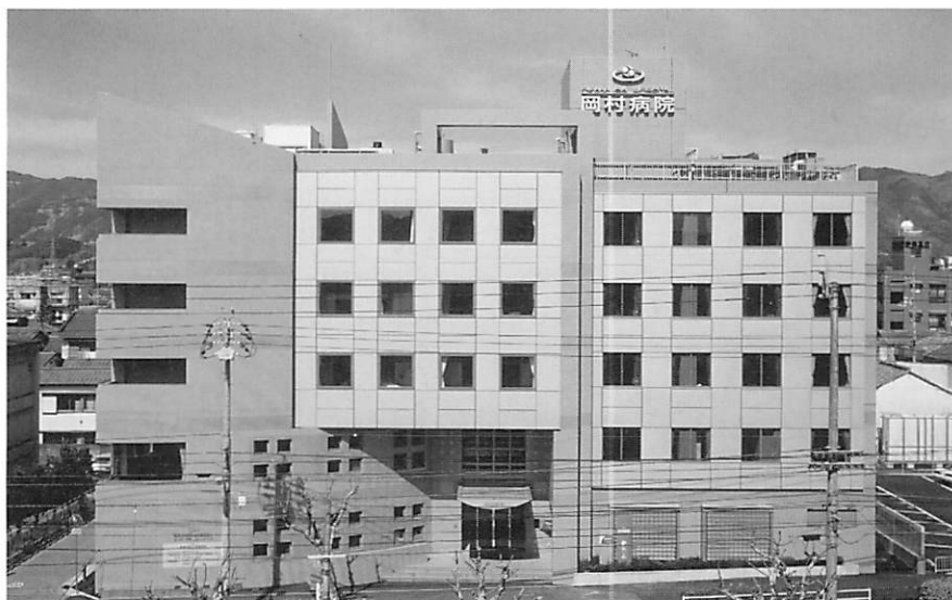
岡村病院正面（平成6年2月28日 落成）

私たちは、患者さん本位を第一に考え 高度な専門医療技術をもって 地域社会に貢献することを目指します。