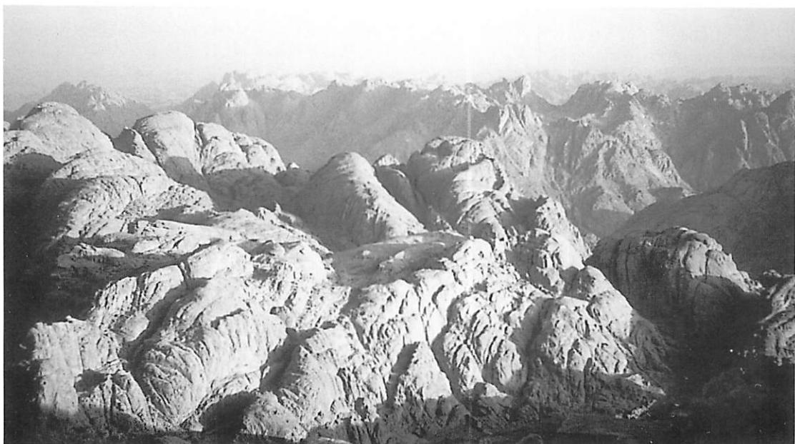
シ ナ イ 山 (エジプト)